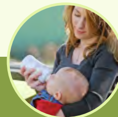
Säuglinge und Kleinkinder pflegen